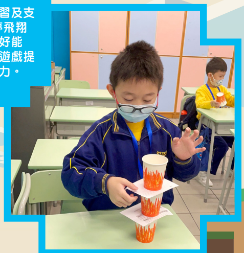
校本課後學習及支援計劃-童夢飛翔小組「玩出好能力」，透過遊戲提升學生專注力。