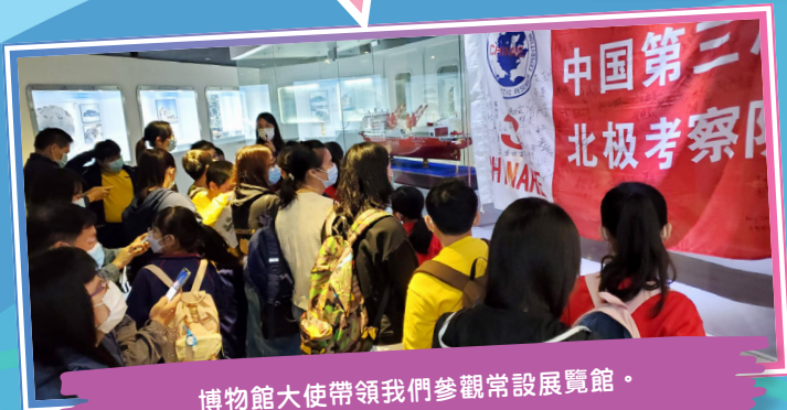
博物館大使帶領我們參觀常設展覽館。