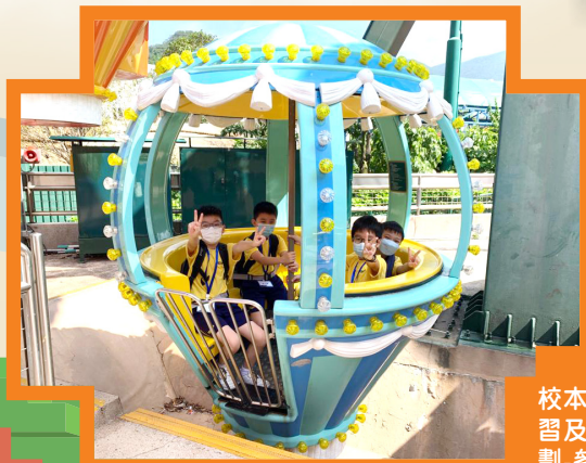
校本課後學習及支援計劃-參觀海洋公園