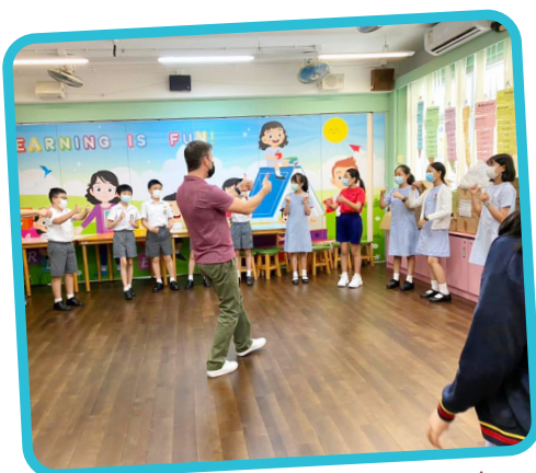
Mr Shamus is leading the P.6 students in a self-introductory speaking activity.