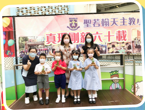
一年級獲獎學生手捧禮物花卉大合照。