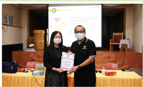
本校參與賽馬會「顫動人心」社區計劃急救教育講座

本校全體教師於2022年5月12日參與香港聖約翰救護機構舉辦之賽馬會「顫動人心」社區計劃急救教育講座，教師透過講座增強對急救、CPR及AED的知識，並提高了安全意識。