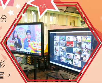
學生精神奕奕地在家中參與中國文化活動日

番，還配襯了精緻的飾物，十分應節。活動的壓軸環節是緊張又刺激的大抽獎！校長和教師從各班中抽出一位位幸運兒，送出大量富中國文化色彩的手工禮物，大家都十分興奮，場面熱鬧。於是，中國文化活動日就在一片歡樂聲中完滿結束了。