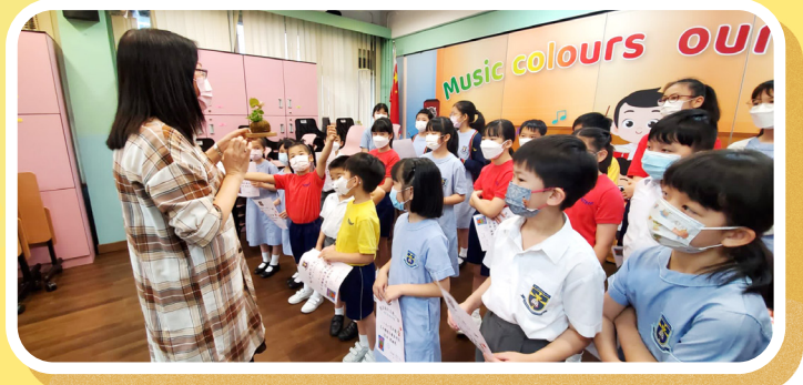
陳校長向學生介紹花卉禮物，教導學生要好好愛惜花卉。