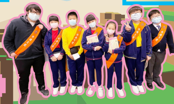
言語治療師與伴讀大使為一至三年級學生進行伴讀