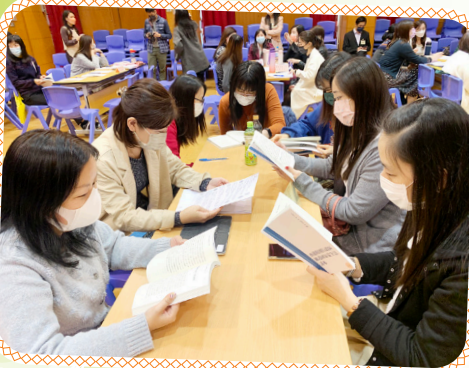
教師閱讀教育局派發的《香港特別行政區維護國家安全法讀本》

本校於2021年12月14日聯同兩間教區小學，樂華天主教小學、天主教佑華小學，參加教育局主辦之「國家安全教育到校教師工作坊」。教師透過講者解說、討論和互動環節，理解如何在課堂內外加強統籌策劃以推行國家安全教育，以及了解教育局的學與教資源，工作坊使全體教師更清楚認識國家安全的重要性。