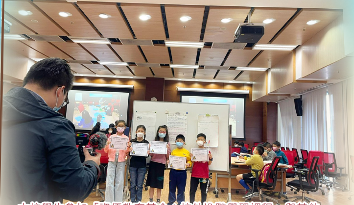
本校學生參加「資優教育基金：校外進階學習課程」與其他學生的尖子一起學習。

本校為實踐「全校參與」模式融合教育，本校以跨專業團隊模式支援不同教育需要的學生，如：駐校言語治療師、外聘職業治療師及教育心理學家；就課程、教學策略及考試調適等安排作調適，設不同的拔尖補底學小組及推薦學生參加校外資優課程，推行校本課後學習及支援計劃，照顧不同需要的學生。