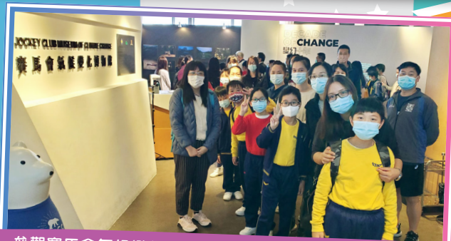
參觀賽馬會氣候變化博物館後，大家認識氣候變化的潛在威脅，亦啟發我們應對氣候變化的新思維和實際行動。

家長教師會於11-12-2021(星期六)與常識科合辦親子參觀賽馬會氣候變化博物館活動，對象為小五及小六合共20個家庭。在活動中，家長與學生一起參觀位於香港中文大學內的賽馬會氣候變化博物館，讓大家緊貼及掌握可持續發展的趨勢，凝聚環保力量。最後更有機會在中大院區內悠閒地走走，渡過了充實的一個早上。