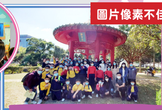
我們齊齊在中大院區來個大合照！