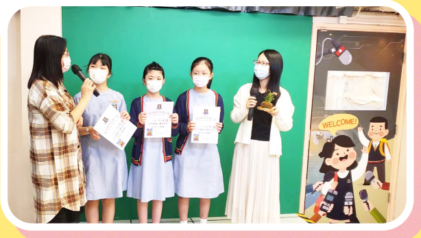
2021至2022年度一人一花計劃花卉種植比賽頒獎。

學校公民教育組於9-6-2022(星期四)早會時舉行2021至2022年度一人一花計劃花卉種植比賽頒獎禮。本年度種植的花卉名稱是三色堇，全校共有22位學生獲頒嘉許狀。今年學校送出的禮物十分特別，是一盆以苔蘚球作為花盆的蕨類植物。植物直接種植在苔蘚球中，突破了傳統花盆的概念。希望學生能在種植之中，能繼續體驗種植的樂趣。