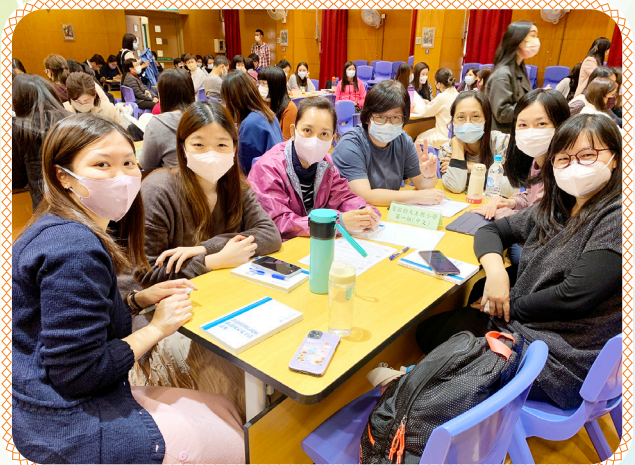
教師透過討論及分享，檢視本校國家安全教育措施