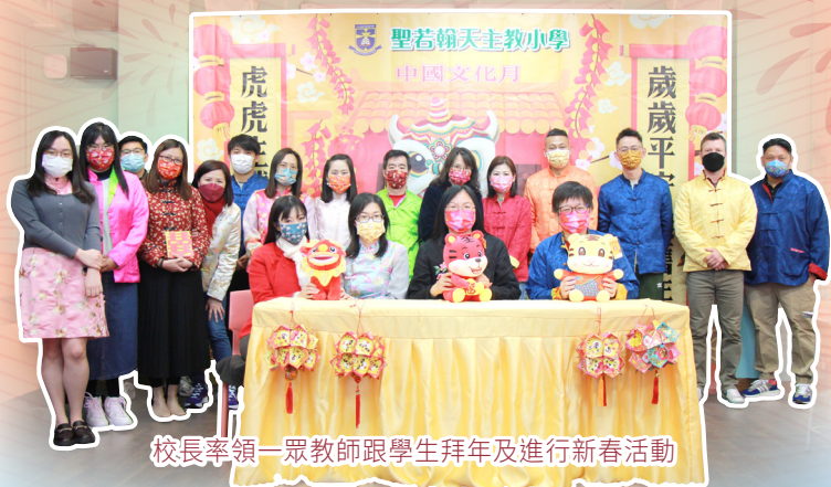
校長率領一眾教師跟學生拜年及進行新春活動