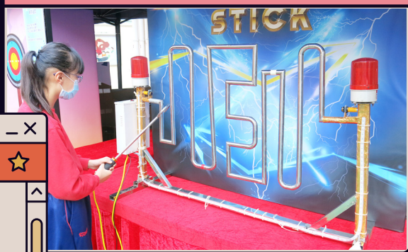
過電棒關卡首重手眼協調及手要穩、眼要定。