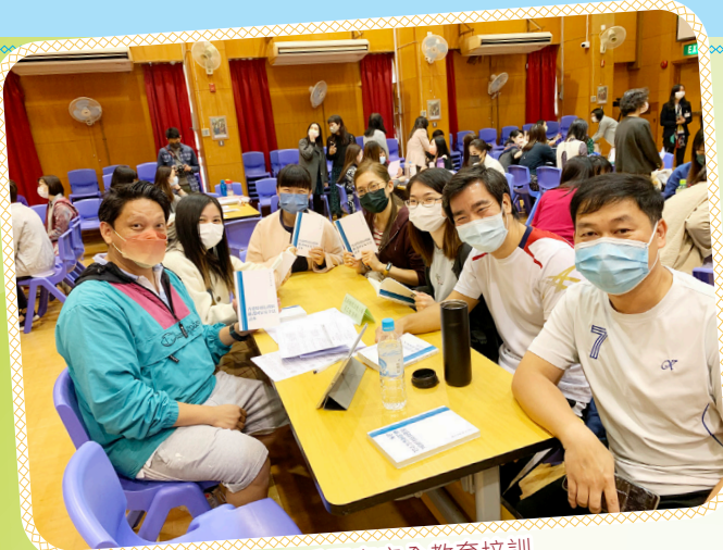
教師接受國家安全教育培訓