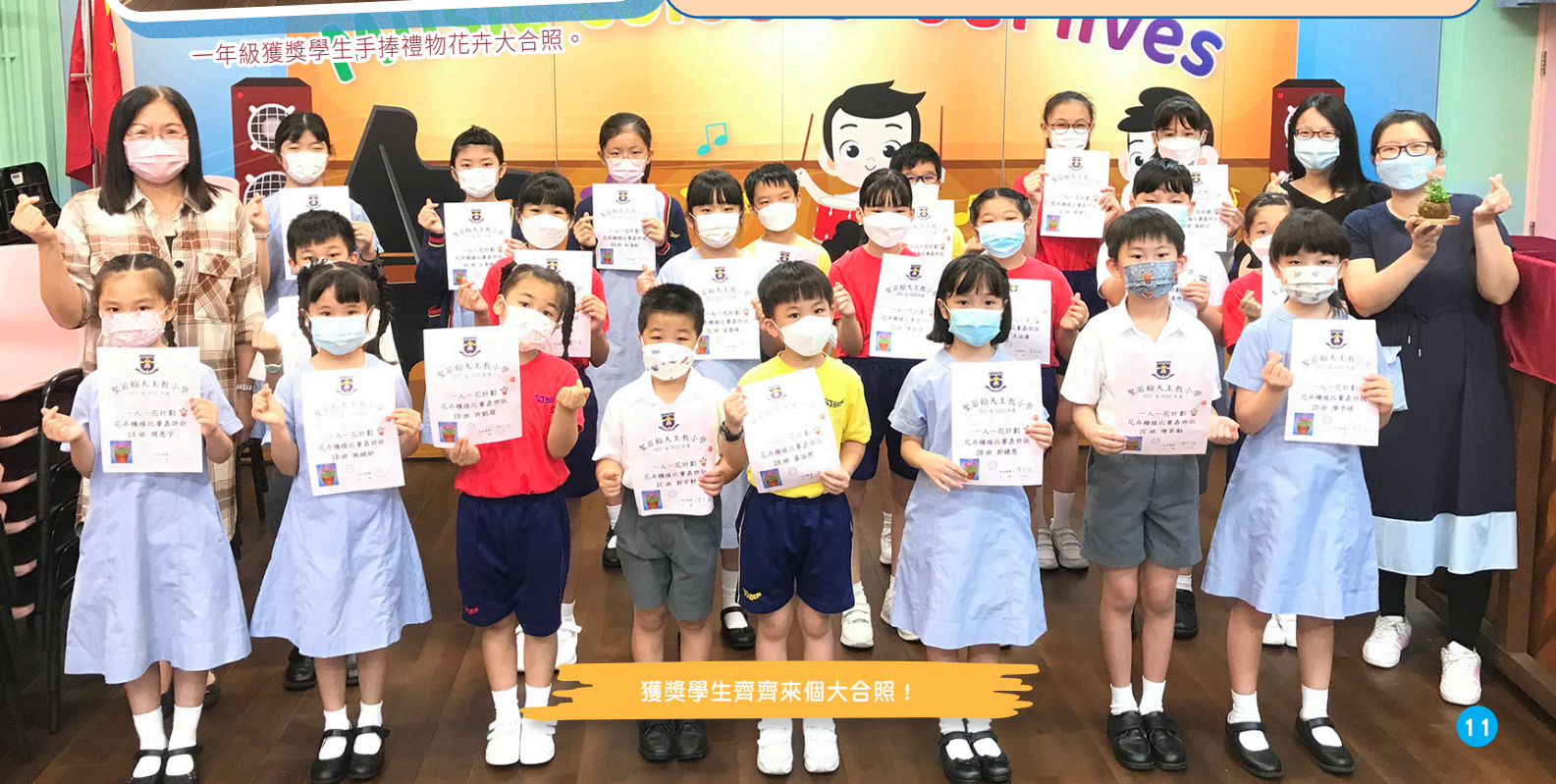
獲獎學生齊齊來個大合照！