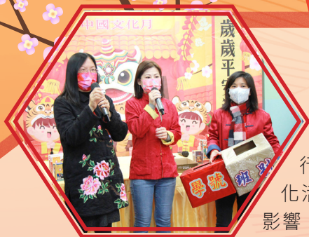
緊張又刺激的大抽獎環節

動日以即時視像的形式進行，但仍然無損聖若翰全體的節慶好心情，大家都不約而同地穿上了各式各樣的中華傳統服飾來參與活動，讓聖若翰充滿着濃厚的新年氣氛。