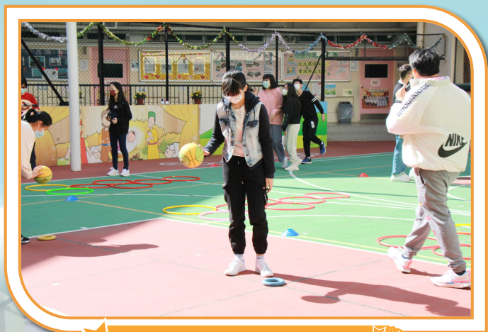
同學們重拾當年遊戲日的歡樂。

「真理剛毅，造極登峰」一句唸熟的校歌歌詞道盡每位畢業生在小學的立志。願每一位聖若翰天主教小學畢業的同學都能持守「真理剛毅」的校訓，讓每一處地方都能看見聖若翰的光。