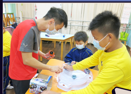
開心換領獎品，獎品琳琅滿目，學生花心思選擇。