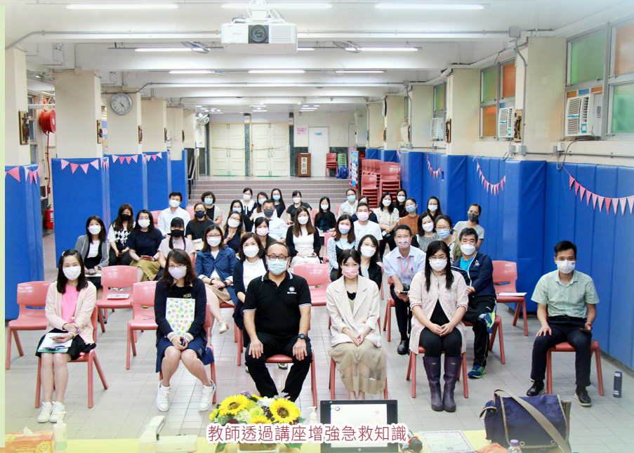
教師透過講座增強急救知識