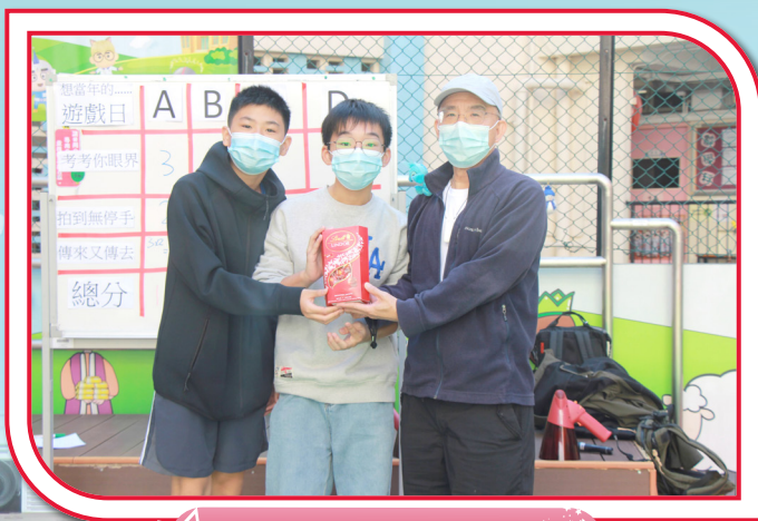
相隔數年，再次獲得勝利！